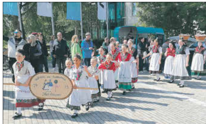
Unsere Kinder- und Jugendgruppe beim diesjährigen Landeskindertrachtenfest in Bad Vilbel