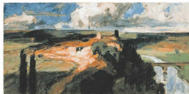
Landschaftsbild mit Hausen, um 1885/86, Öl auf Leinwand

Der Kalender kostet 12,90 Euro und ist im Otto Ubbelohde-Haus in Goßfelden (geöffnet sonntags von 13 bis 16 Uhr), bei Familie Seitz in Goßfelden, Roßweg 15a und bei Familie Görmar, Sarnau, Am Sportplatz 10 erhältlich. Er kann auch bestellt werden unter Tel.: 06423/6785 (ggf. AB, dann bitte Name, Adresse und Anzahl der Kalender mitteilen) oder per E-Mail an besuch-o-u-haus@web.de. Beim Postversand wird das Porto mit in Rechnung gestellt.